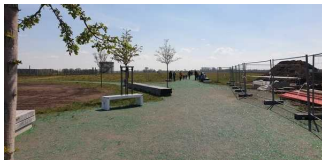
Zugang zum Gelände