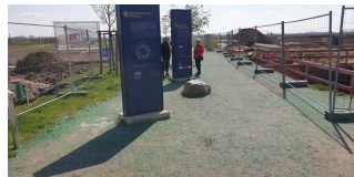
Zugang zum Gelände