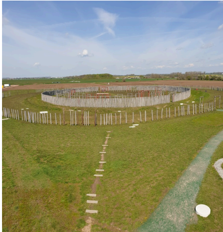
Ringheiligtum Pömmelte